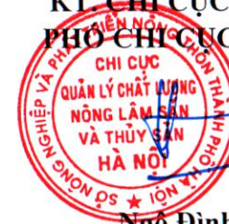
Ngô Đình Loát