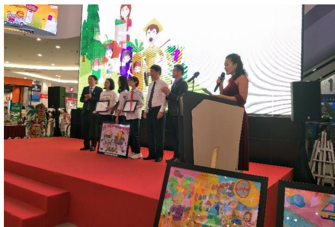
Lễ trao giải vẽ poster

Những tấm poster có nội dung "cảm nhận về rau an toàn" của các em học sinh học về "hành trình rau an toàn", "bắt đầu từ việc đảm bảo nguồn nước và đất an toàn của người sản xuất đến việc trồng rau an toàn cẩn thận và mang đến cửa hàng" thu hút sự chú ý của người tiêu dùng nói chung. Vì vậy những bức poster được lựa chọn cuối cùng sẽ được trưng bày tại AEON MALL hàng năm. Năm nay, triển lãm được tổ chức tại nơi tổ chức hội chợ thương mại nông sản do HPA tài trợ nhằm khơi dậy sự quan tâm của người tiêu dùng và đồng thời giao lưu với người sản xuất. Sự kiện triển lãm này giúp nâng cao nhận thức không chỉ cho những người liên quan đến trường học mà còn cho nhiều người tiêu dùng.