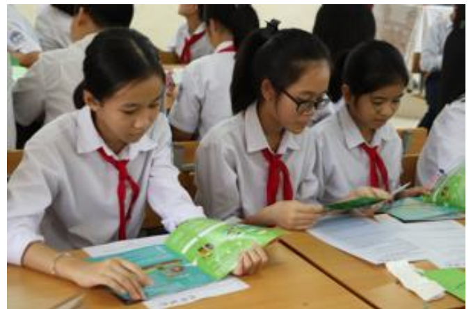
Chương trình giáo dục học đường

Hàng năm, phụ huynh và giáo viên đã đưa ra những đánh giá tích cực, chẳng hạn như “sự tương tác giữa cha mẹ và con cái đã được thúc đẩy”, “một chương trình có sự tham gia nhiệt tình của phụ huynh” và “sự ủng hộ tích cực của phụ huynh đã được nhìn nhận”. Kết quả của việc xem xét các mục tiêu khác nhau và các hoạt động trong 3 năm qua đã khẳng định rằng lớp 7 là lứa tuổi mà các em có thể truyền đạt một cách đúng đắn những gì đã học đến cha mẹ và rất thích hoạt động vẽ poster. Vì vậy, "Giáo dục học sinh lớp 7 và vẽ poster" đã được quyết định là một dạng mẫu cho các hoạt động nâng cao nhận thức của người tiêu dùng trong tương lai như một phương pháp thực hiện bền vững và hiệu quả nhất.