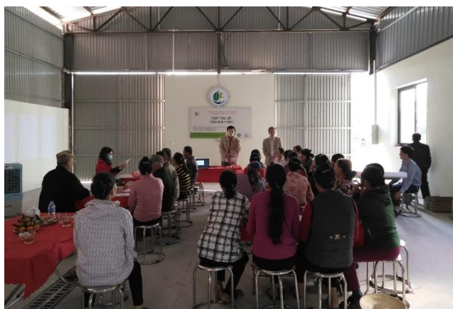
Hội thảo tại HTX Tân Minh Đức (Hải Dương)

Trong tháng 12/2020, Ban quản lý Dự án trung ương (CPMU) đã tổ chức các buổi tọa đàm với các nhóm mục tiêu tham gia Dự án tại các tỉnh/Thành phố Hải Phòng (HTX DV Chân nuôi Thái Sơn), Bắc Ninh (HTX DVNN thôn Ngâm Mạc) và Hải Dương (HTX DVNN Tân Minh Đức). Tham gia buổi tọa đàm có sự tham gia của Ban quản lý dự án địa phương (PPMU) và VP dự án JICA.