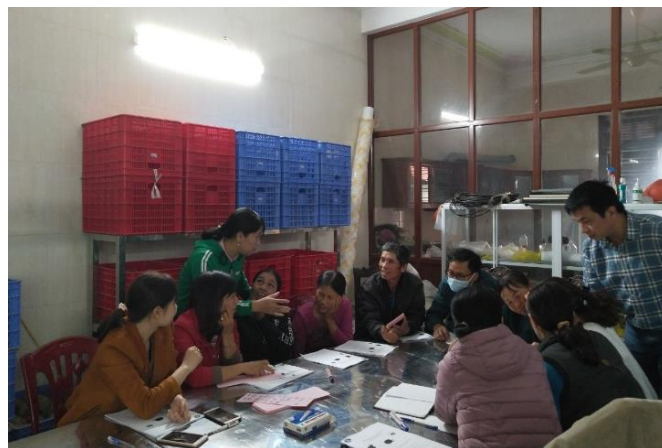
Thảo luận nhóm tại HTX Thái Sơn (Hải Phòng)

CPMU đã ghi nhận toàn bộ các nội dung thảo luận, cũng như đề xuất, kiến nghị từ phía nông dân trong mô hình. Tiếp đó, CPMU sẽ chuyển lại những đề đạt này tới các bên có liên quan, cụ thể là Sở NN và PTNT, Bộ NN&PTNT để có những hỗ trợ cụ thể cho các nhóm này nhằm tiếp tục duy trì và phát triển các kết quả của Dự án, ngay cả sau khi Dự án kết thúc.